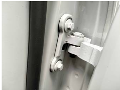
Porte arrière gauche (Autre Défaut)