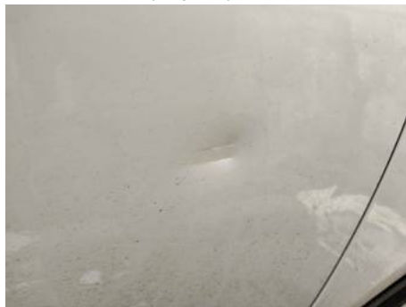
Porte avant droite (Impact)