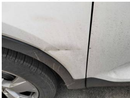
Aile avant gauche (Impact)